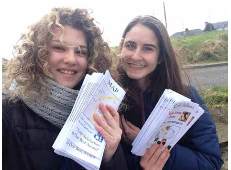
Figure 16-17 Mobilità in Irlanda, 2016