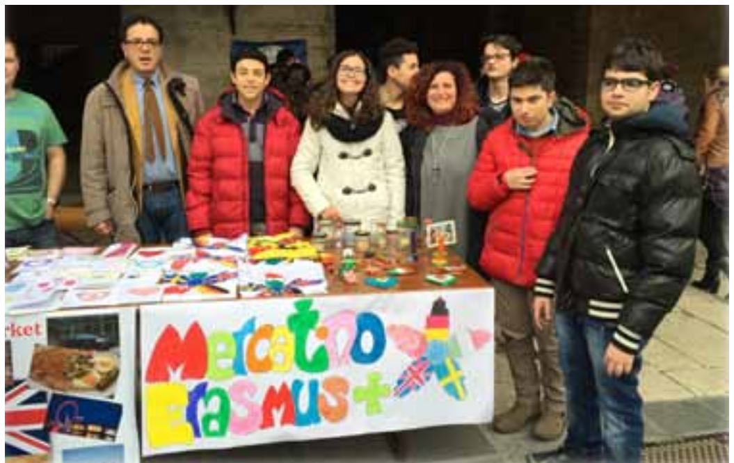
Figura 8 - Meeting in Italia, 2016