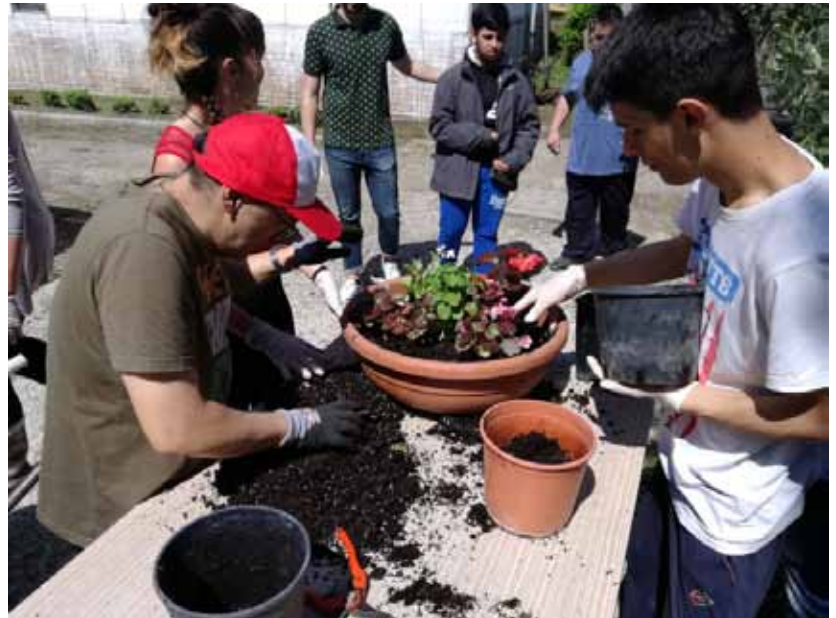
Figura 31-32 Studenti del progetto “al lavoro”