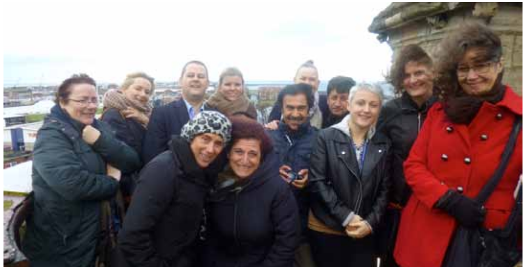
Figura 7 - Meeting organizzativo in Inghilterra, 2015

tica di una formazione non solo permanente (lifelong), ma anche “diffusa” (lifewide). Ogni competenza imprenditoriale è stata poi declinata in livelli di abilità, creando un framework utilizzabile anche per la valutazione.