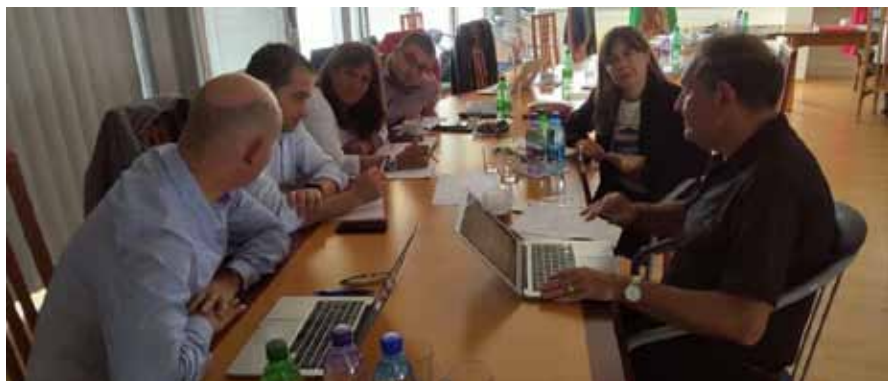
Figura 30 - Meeting in Slovacchia, 2019