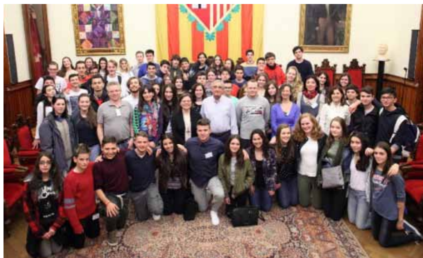
Figura 2 - Meeting in Spagna, 2016

L' "anima" del progetto ha raggiunto il suo obiettivo anche attraverso il coinvolgimento delle famiglie che hanno concretamente sperimentato nuove forme di relazione umana e culturale. Ospitando ragazzi di nazionalità diverse, coetanei dei propri figli, si sono messe in gioco ed hanno abbattuto qualsiasi timore e pregiudizio cogliendo invece una opportunità di arricchimento umano ed emotivo.