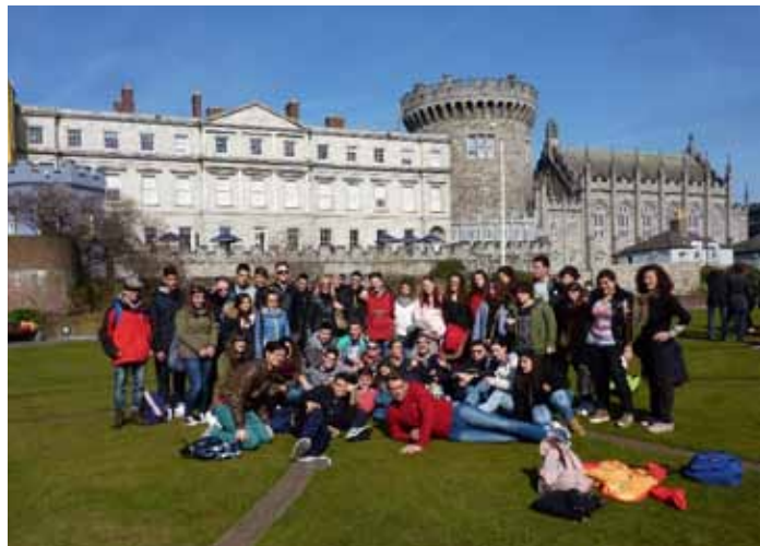
Figura 38 - Studenti e docenti in visita al Castello di Dublino, 2015