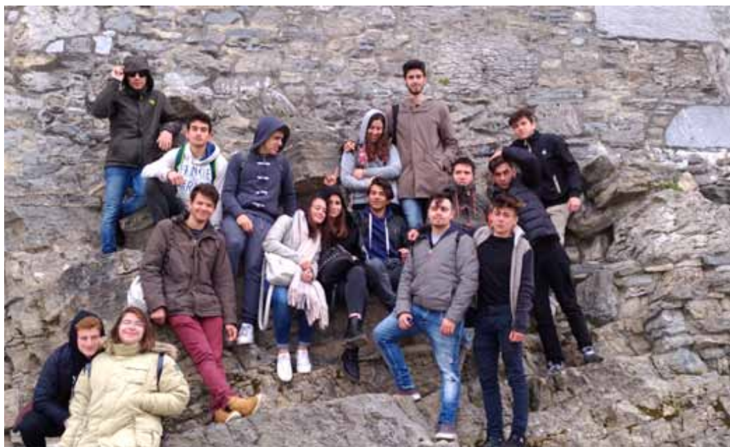
Figure 19-20 Mobilità in Irlanda, 2017