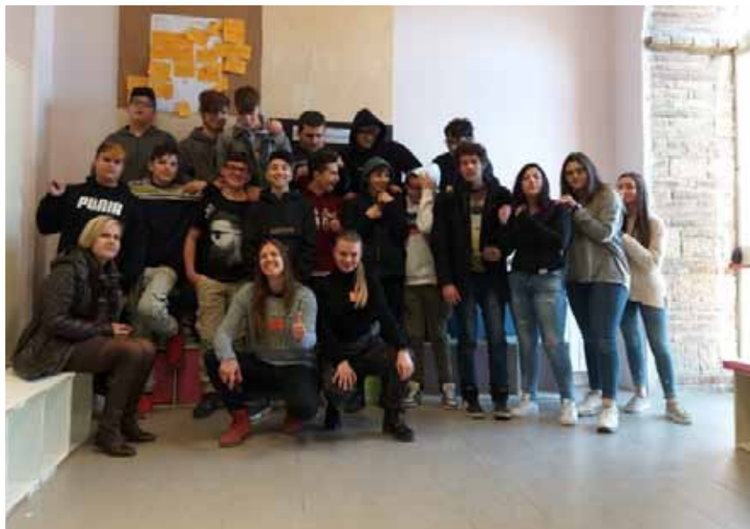
Figura 47 – Lezione presso IPSI, 2019