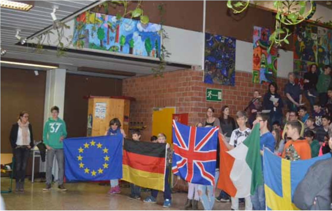
Figura 9 - Meeting in Germania, 2017