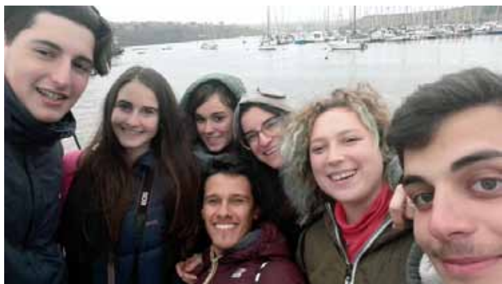
Figura 18 – Mobilità in Irlanda, 2016