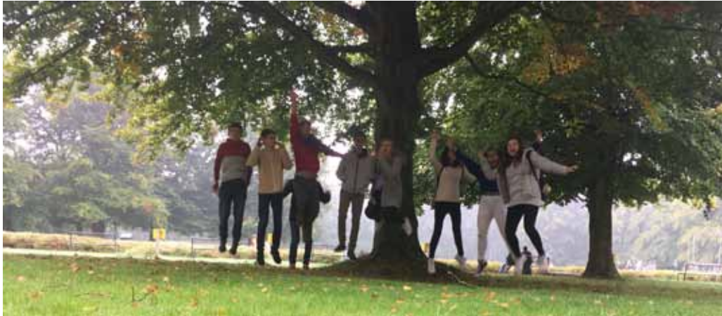
Figura 5 - Meeting in Olanda, 2017