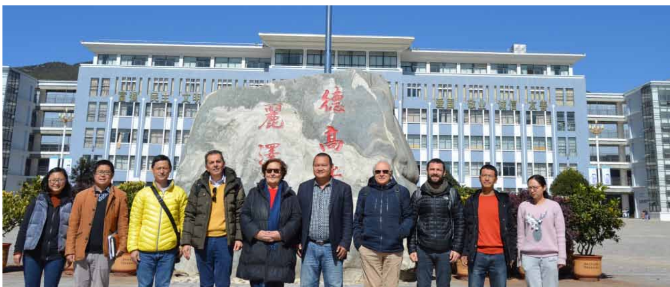
Figure 58-59 – La delegazione italiana all'Università dello Yannan, 2018