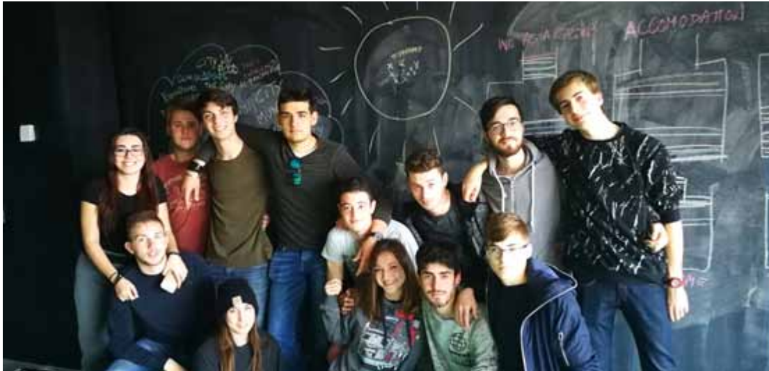
Figura 21 - Mobilità in Spagna, 2017