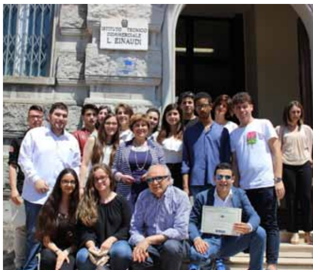
Figura 34 - Festa dell'Europa, 2018