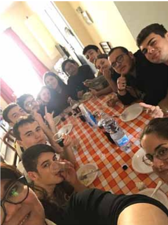
Figura 25 - Mobilità a Malta, 2019