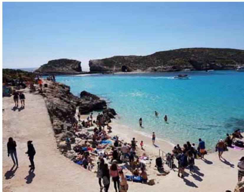
Figura 40 – Un tuffo nell'azzurro mare di Comino (Malta), 2017