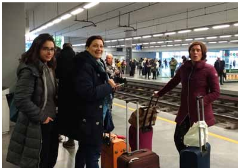
Figura 26 - Mobilità in Portogallo, 2018