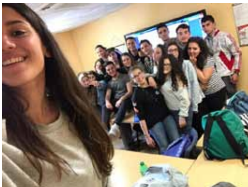
Figura 39 – Malta: studenti a lezione presso la scuola di Sliema, 2017