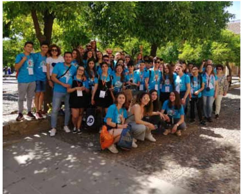
Figure 13-15 - Meeting in Spagna, 2019