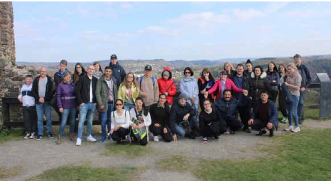
Figura 10 - Meeting in Germania, 2017