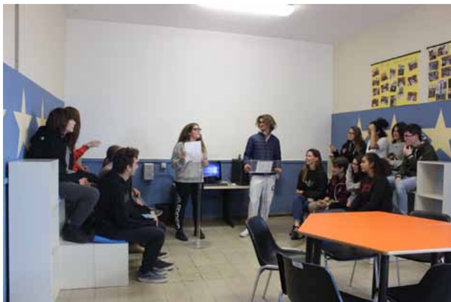
Figura 1 - Lo "Spazio Europa" della sede Einaudi, con gli studenti impegnati in un debate

curricolari ed extracurricolari, la quale è diventata il nostro "Spazio Europa". L'aula, che vede campeggiare sui muri le 12 stelle dell'Unione Europea su sfondo blu, è allestita con tavoli modulari per permettere il lavoro di gruppo e cooperativo e con postazioni ad hoc per il debate.