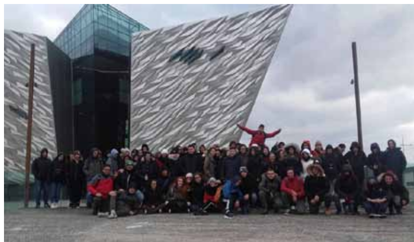
Figura 42 – Belfast: visita al Museo del Titanic, 2018