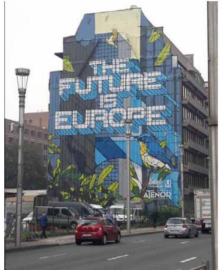
Figura 6 - Meeting finale in Olanda, 2018