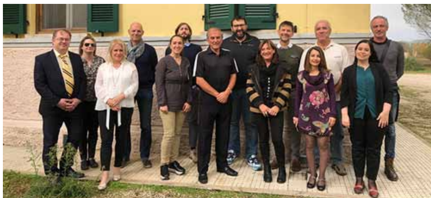
Figura 29 - Il gruppo dei docenti coordinatori del progetto SEED

L'azione chiave 3 del programma è dedicata alle attività a sostegno delle politiche in tema di istruzione, formazione e gioventù. Si tratta di attività varie che possono riguardare: conoscenza nei settori istruzione, formazione e gioventù (conoscenze tematiche e per paese, studi sulle politiche, le attività della rete Eurydice ecc.); iniziative di prospetto volte a sviluppare nuove politiche o a predisporre l'attuazione, che si distinguono in iniziative per progetti di cooperazione sullo sviluppo delle politiche e iniziative per progetti di sperimentazione sulle politiche europee; il supporto agli strumenti europei, tra cui quelli per il riconoscimento delle qualifiche e delle competenze; la cooperazione con le organizzazioni internazionali, il dialogo con gli stakeholders e i Paesi Terzi.