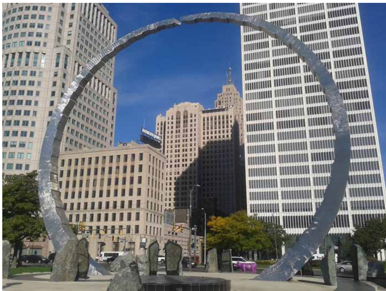
Figura 53 – La downtown di Detroit