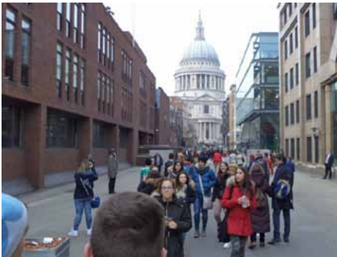
Figura 37 – Stage linguistico a Londra, 2014