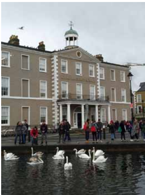
Figura 41 – Studenti davanti alla scuola di Dublino, 2018