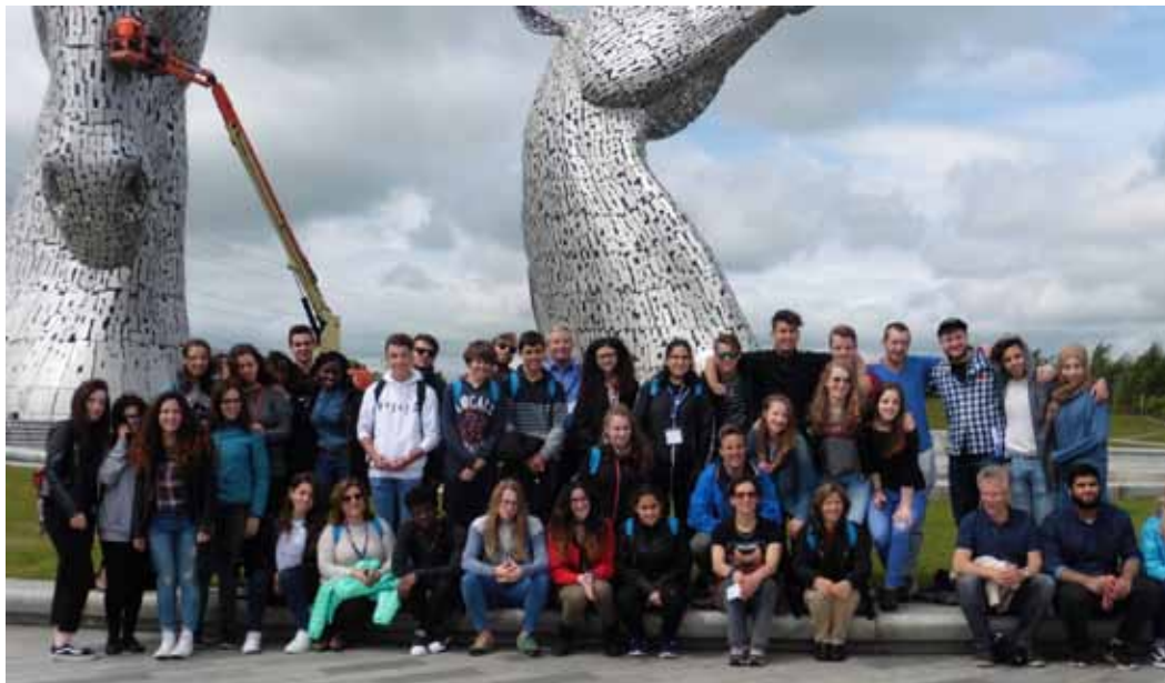
Figura 4 - Meeting in Scozia, 2017