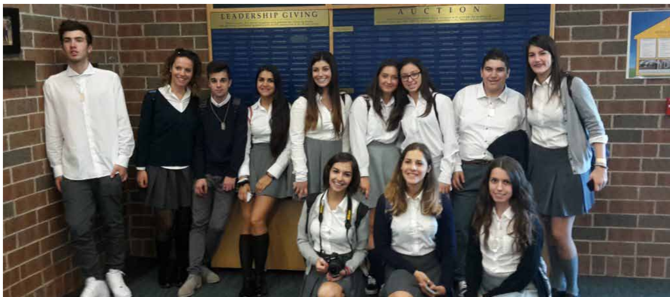
Figura 49 - Gli studenti del Ciuffelli-Einaudi e dello Jacopone alla DCDS, con la divisa della scuola