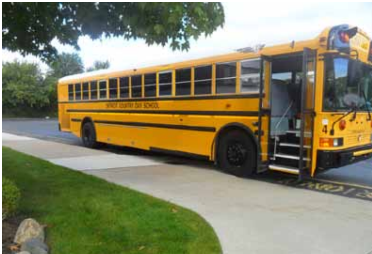
Figura 51 - L' autobus arancione della DCDS