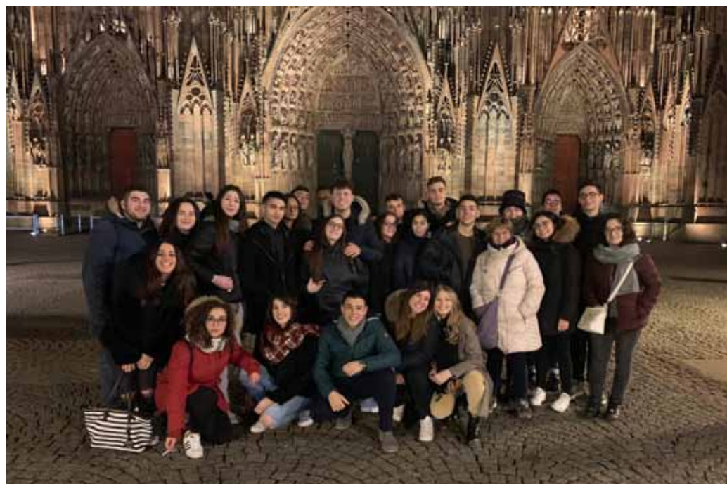
Figura 36 - Studenti e docenti a Strasburgo per il progetto Euro-scola, 2019