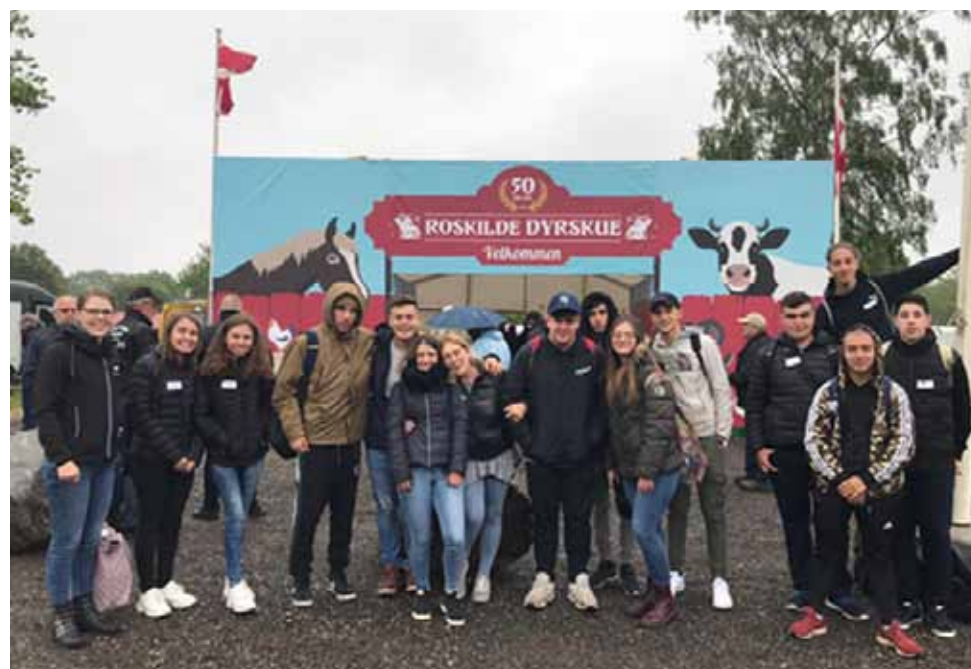
Figure 27 - 28 Mobilità in Danimarca, 2019