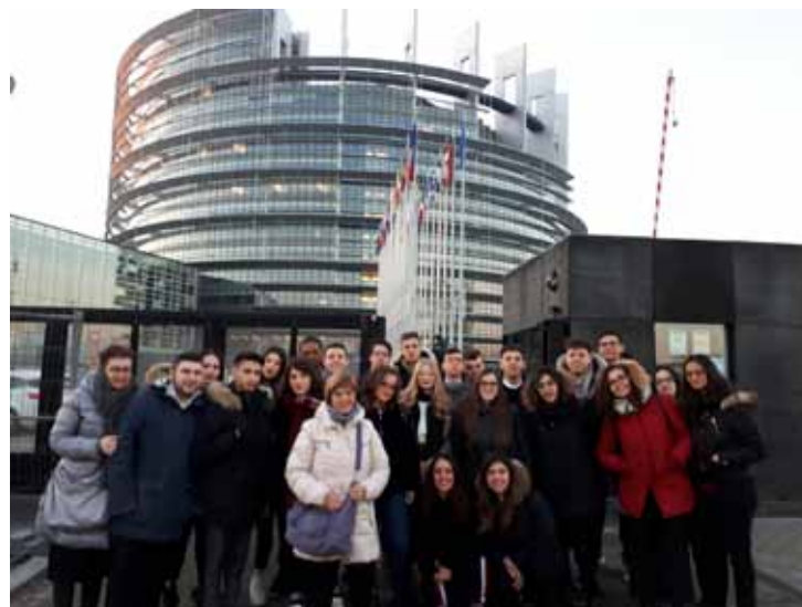
Figura 35 - Studenti e docenti a Strasburgo per il progetto Euro-scola, 2019