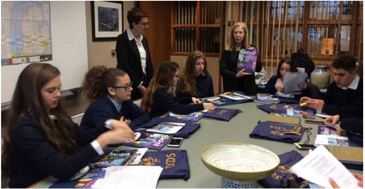
Figura 50 - Il gruppo del gemellaggio al lavoro in un'aula della DCDS