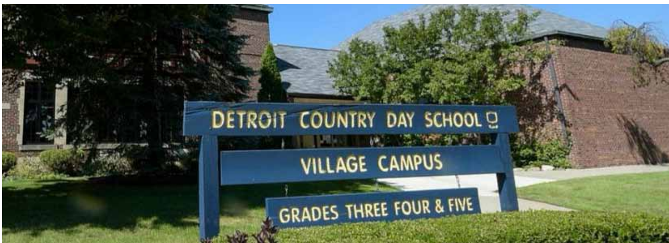
Figura 48 - Esterno di uno degli edifici della DCDS di Detroit