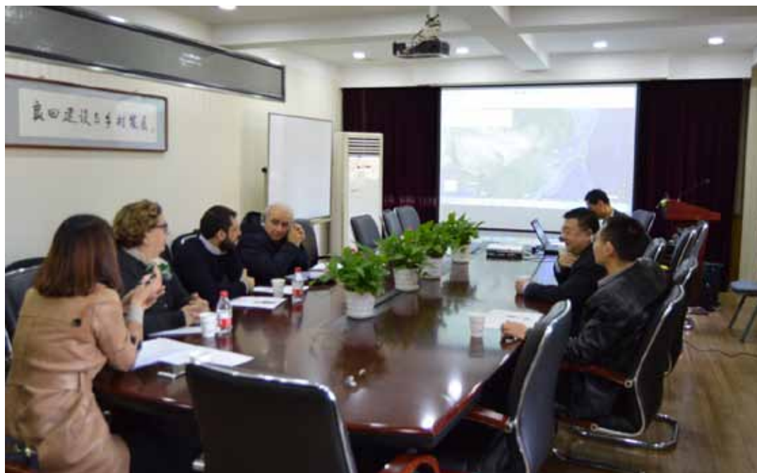
Figure 55-56 Visita della delegazione italiana al Dipartimento di Agricoltura di Pechino, 2018