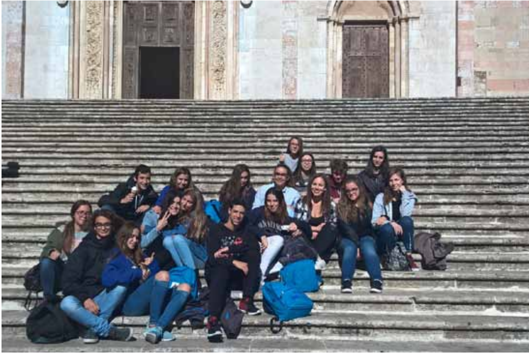
Figura 3 - Meeting in Italia, 2016