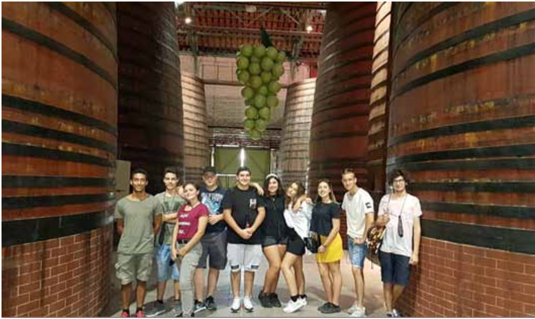
Figure 22-23 Mobilità in Francia, 2018