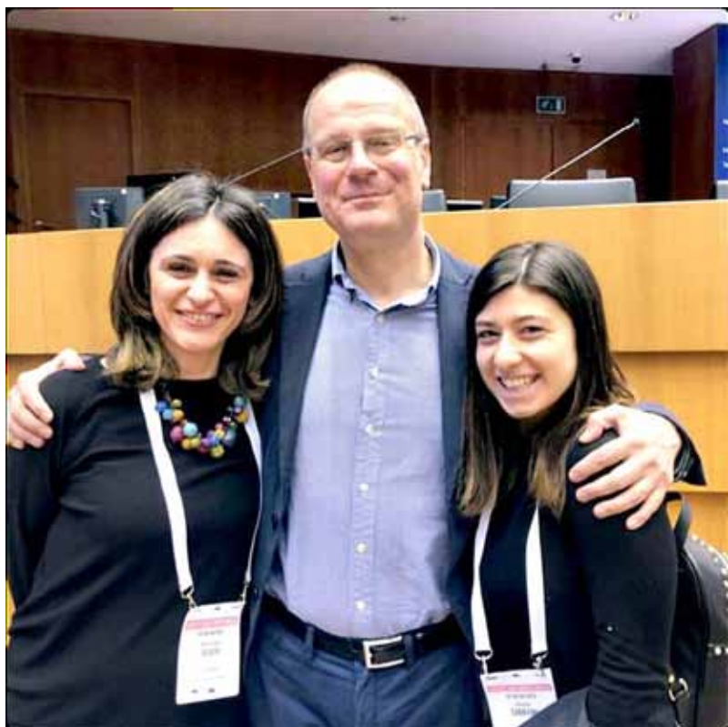
Figura 33 - La nostra delegazione alla European Youth Week a Bruxelles

Grazie alla partecipazione al Programma Scuola Ambasciatrice, una rappresentanza di docenti e studenti dell'Istituto è stata invitata a partecipare nel mese di aprile 2019 alla European Youth Week a Bruxelles, presso il Parlamento Europeo. L'evento, finalizzato a incoraggiare la partecipazione attiva dei giovani nella società, viene organizzato ogni anno dalla Commissione Europea in partenariato con il Parlamento Europeo; per l'edizione 2019, in particolare, è stato scelto il titolo “Democracy and me”.