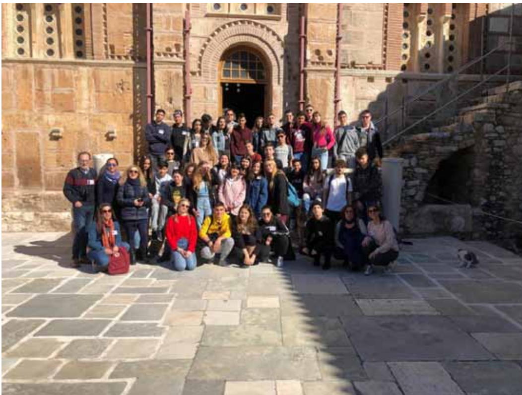
Figura 11 - Meeting in Grecia, 2019

Gli obiettivi del progetto verranno raggiunti utilizzando anche la metodologia del Debate che favorirà lo sviluppo del pensiero critico, agendo contestualmente in maniera positiva sullo sviluppo delle competenze linguistiche e sulle soft skills.