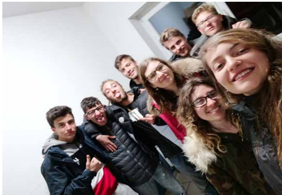
Figura 24 - Mobilità in Germania, 2019