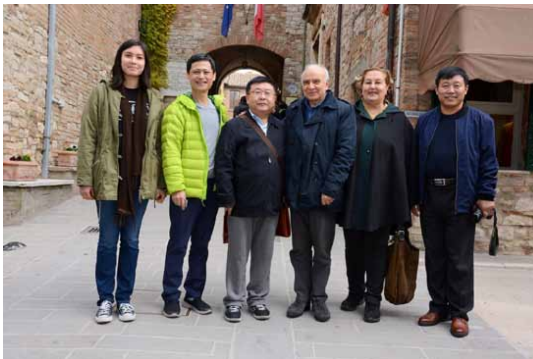
Figura 54 Visita della delegazione cinese al Ciuffelli, 2017